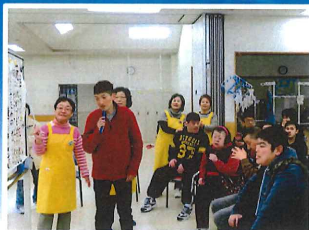
レクリエーション・タッチ様