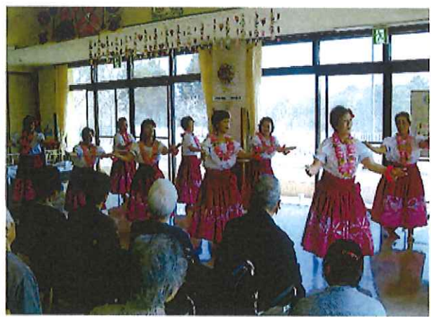
ダンス・ダイヤモンドガールズ様