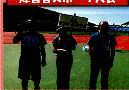
障害者スポーツ大会