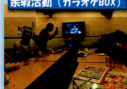
余暇活動（カラオケBOX）