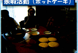
余暇活動（ホットケーキ）