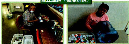
自立課題（機能訓練）