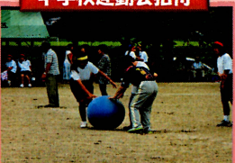
中学校運動会招待