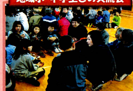
地域小・中学生との交流会