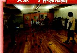
スポーツ体験活動